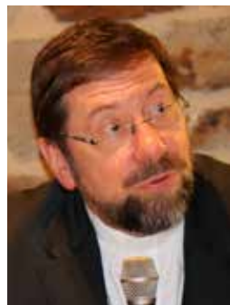
Jean-Pierre Delville Évêque de Liège